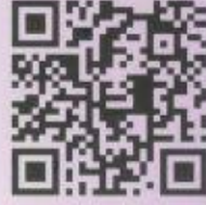
VÍCE O WORKSHOPU