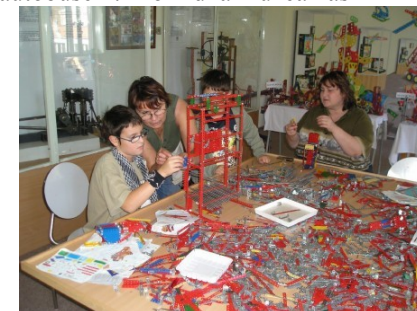
odzkoušení samotné stavby