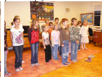
vánoční dílny - program koled

V prosinci se těšíme na koncert sboru Carmina, který vystoupí ve Vamberku. A pak už na adventním věnci zapálíme poslední svíčku, která bude znamením, že se blíží vánoční prázdniny. Přejí všem dětem pohádkové Vánoce a dospělým mnoho štěstí do Nového roku.