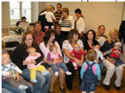
Vítání občánků v mateřském centru