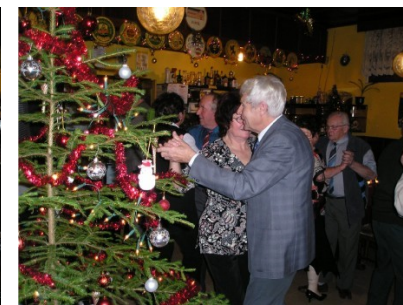
Mikulášské posezení v Penzionu Orlice

10. prosince jsme pomohly s organizací Rekordu ve vypouštění balónek. Více v článku níže.