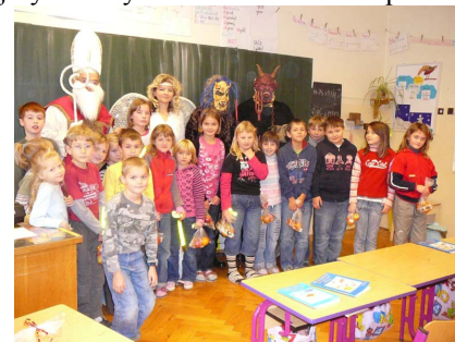
návštěva Mikuláše s čerty a andělem

V úterý 8. prosince se ve škole konaly již tradiční vánoční dílny. Po krátkém pásmu koled a básniček následovalo vyrábění svícňů, zvonečků a jiných malých drobností. Celé odpoledne proběhlo v příjemné vánoční náladě.