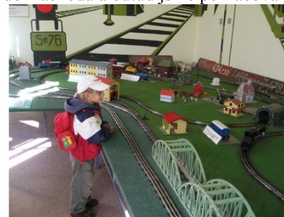
Expozice stavby Merkur